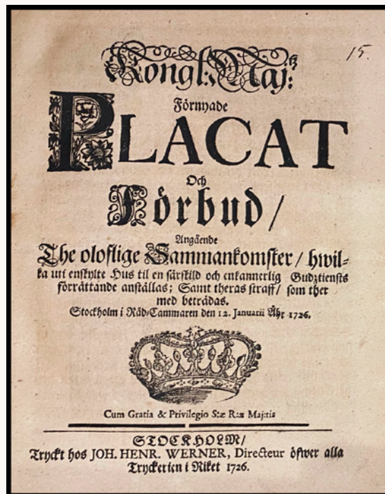
Kuninkaallinen asetus konventikkeliplakaatti v. 1726 kielsi yksityiset hartauskokoukset rangaistuksen uhalla.

lius nuorempi, oli opintomatallaan Saksassa tavannut Spenerin ja Schützen 1670-luvulla. Hän jopa käänsi Jakob Schützen kirjan Kristillinen muistikirja suomeksi ja ruotsiksi. Kirjassa annetaan neuvoja, miten syntisestä elämästä luovutaan ja miten kristityn olisi syytä menetellä jumalattomassa maailmassa. Kun Turussakin koettiin myöhemmin hurmoksellisuutta ja pietistisiä kokoontumisia, Gezeliukset ottivat etäisyyttä pietismiin ja esimerkiksi juuri Schützen kirjaan. Ruotsi-Suomessa astui voimaan vuonna 1726 kuninkaallisella asetuksella ns. koventikkeliplakaatti , joka kielsi hengelliset kokoontumiset ilman papin läsnäoloa. Raamatun tai hartauskirjojen luku kodeissa oli edelleen sallittua oman perheväen kesken. Konventikkeliplakaatti kumottiin Suomessa vasta vuonna 1870 uuden kirkkolain käyttöönoton myötä.